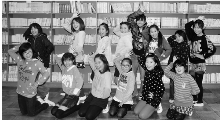
元気いっぱい仲よし14人♪