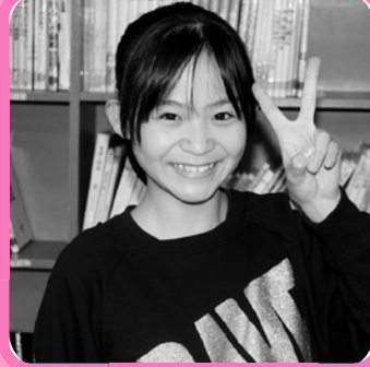
スローガン 「その一票 明るい未来の 掛け橋に」

『長生郡市のスローガンに選ばれるなんて本当に驚きました。賞をいただくことができ、文章を書くことに対し、自信を持てるようになりました』