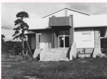
写真1 開館当時平屋だった資料館

の本棚が見えた。当時の展示物は、あんどん・よろい・銭箱・土睦小学校校庭から出土した太刀・妙楽寺地区出土銭・東谷横穴1号墓出土品・熊野神社裏遺跡出土子持勾玉・吉良氏(蒔田氏)関係資料の吉良氏系図や朱印状などで、これらの中からは後に指定文化財になった名品も多い。これらの展示物は、このたびの開館30周年記念企画展「第10回館蔵名品展」で展示の予定。