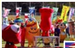
●もみ太郎選手宣誓!