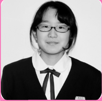
ポスターコンクール 長生郡支会長賞受賞

『何度も描き直しをし、朝方まで描くことも多々ありました。大変でしたが、賞をとることができ本当にうれしかったです』