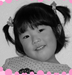
かとう みなもちゃん これからもむしばなしでいこうね☆