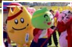
●がんばった玉入れ