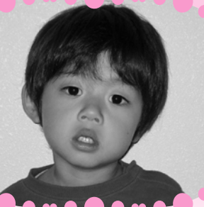
くが りくとくん いつもきれいでいようね!