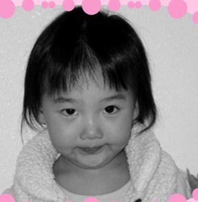
いしだ はづきちゃん めざせ! いっしょうむしばなし!