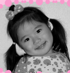
ふるやま のあちゃん ずっとぴかぴかなはでいようね!