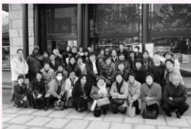
昨年の能楽鑑賞会から

現在1階展示室「農家」のジオラマ展示「井戸汲みの少女」があるあたりは通常の展示スペースで、展示室からは事務室